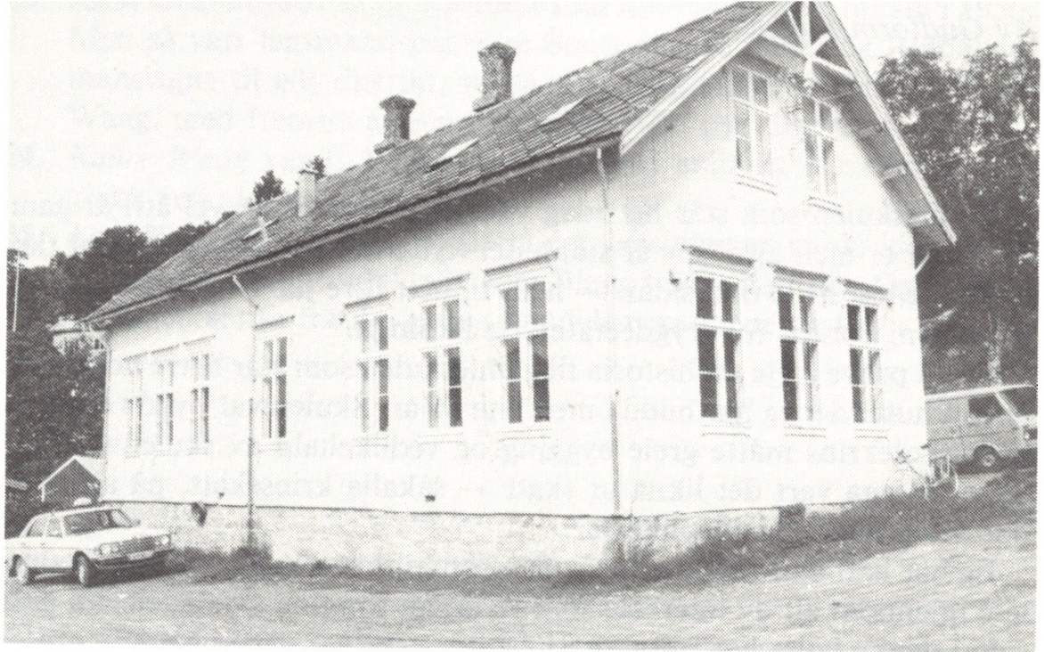
Det gamle skulehuset i Aure sentrum

I samband med bygginga av AK-senteret i 1988 vart det gamle skulehuset rive.